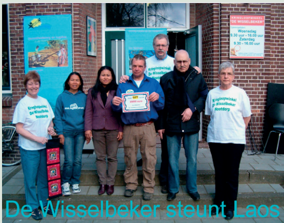
De Wisselbeker steunt Laos